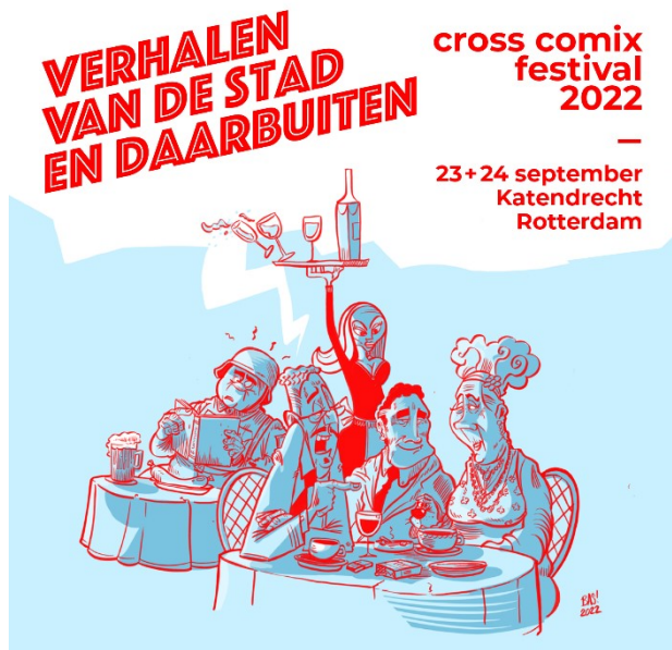
Het gebruikte campagnebeeld

Sociale media vormden de belangrijkste marketingkanalen. Daarnaast distribueerden we op bescheiden schaal flyers. Ook de aanwezigheid op Rotterdam Centraal zorgde voor exposure, net als de connecties met GRAW en Camera Japan. Tot slot was er free publicity in de vorm van een artikel van een halve pagina in een door Droom & Daad via alle landelijke kranten verspreide kunstbijlage.