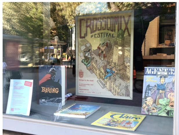
Poster in de etalage bij boekhandel Donner

Veel inspanningen verliepen uiteraard via sociale media. Niet alleen voorafgaand werd gericht gepost en geadverteerd op de diverse te bereiken doelgroepen, maar ook tijdens het festival ging het posten intensief door, om de festivalbeleving ook een beetje op Instagram over te brengen. Dat was effectief. De beoogde groei van 25% aan volgers op Instagram werd behaald, van 1.194 naar 1.480. De groei in Facebookvolgers bleef enigszins achter, van 2.136 naar 2.243.