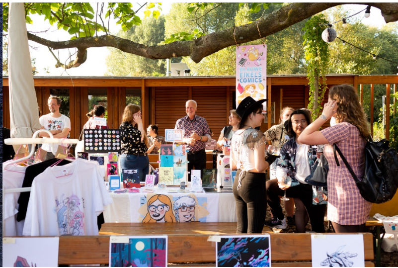
Ontmoeting en small press markt in het Vroesepaviljoen