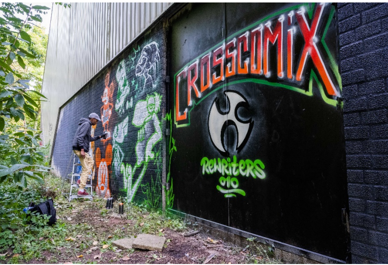
De buitenkant van de tennishal kreeg een remake in samenwerking met Rewriters 010 en Pow! Wow!